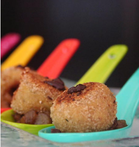
Bouchée de poulet, grué de cacao et chutney de poires aux épices