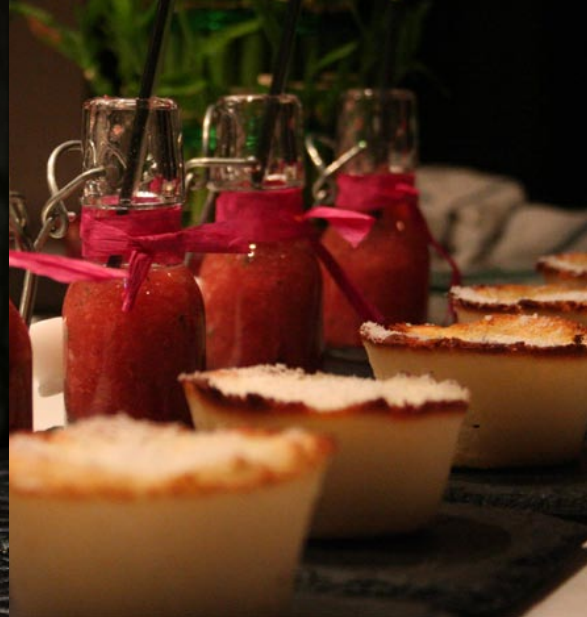
Gaspacho de fraises au basilic et tartelette coco-citron aux épices