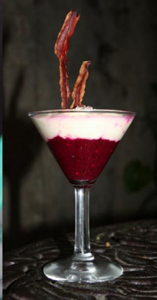
Duo léger de carottes rouges et avocat, croustillant de lard fumé